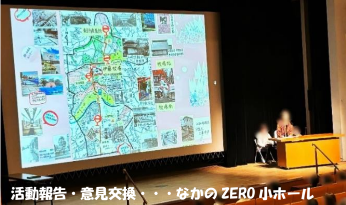
活動報告・意見交換・・・なかのZERO小ホール

中野区 地域活動推進課 なかの生涯学習大学担当 TEL:03-3228-3251 Email:nakano-daigaku@city.tokyo-nakano.lg.jp