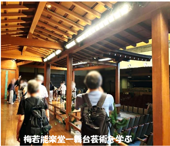
梅若能楽堂一舞台芸術を学ぶ